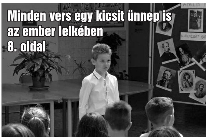
Minden vers egy kicsit ünnep is az ember lelkében 8. oldal