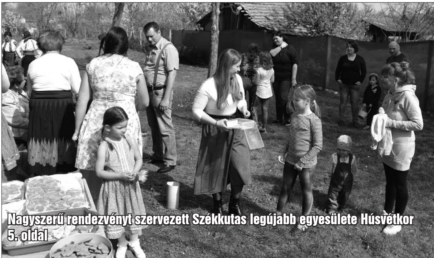
Nagyszerű rendezvényt szervezett Székkutas legújabb egyesülete Húsvétkor 5. oldal