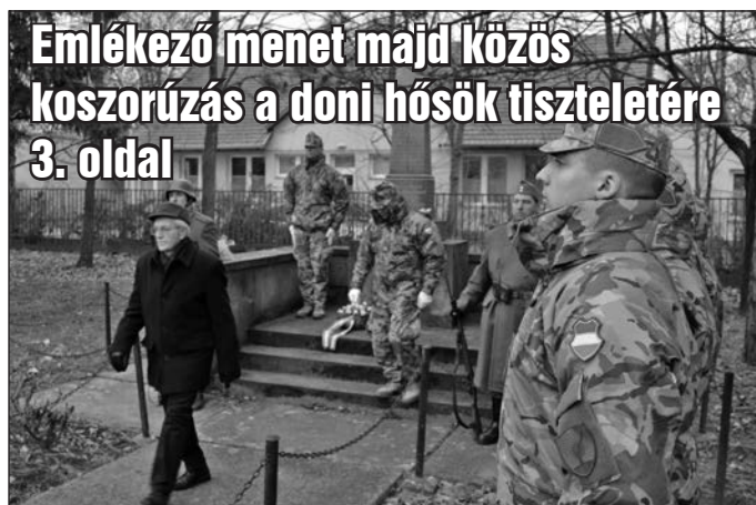
Emlékező menet majd közös koszorúzás a doni hősök tiszteletére 3. oldal

Rengeteg program készül idén is Székkutason