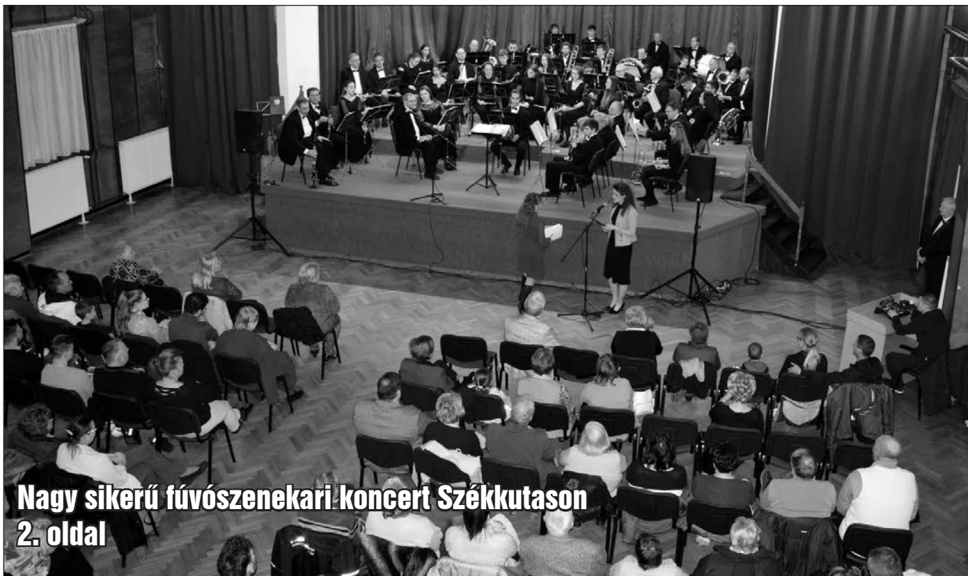
Nagy sikerű fúvószenekari koncert Székkutason 2. oldal