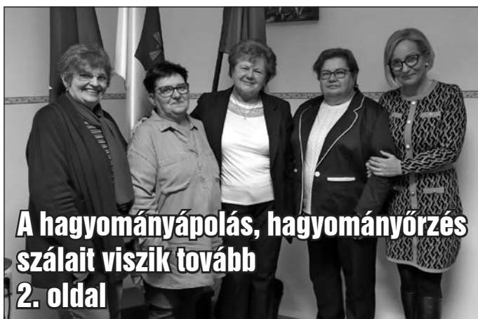
A hagyományápolás, hagyományörzés szálait viszik tovább 2. oldal