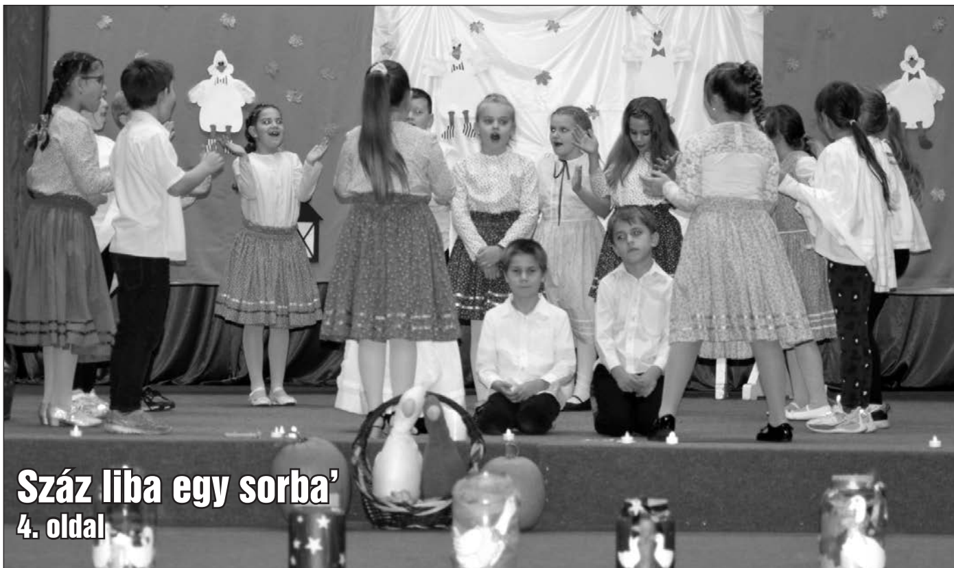
Száz liba egy sorba' 4. oldal