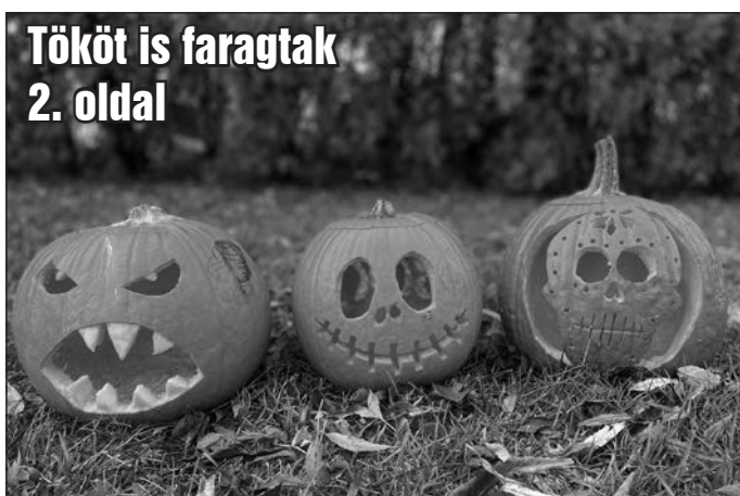
Tököt is faragtak 2. oldal