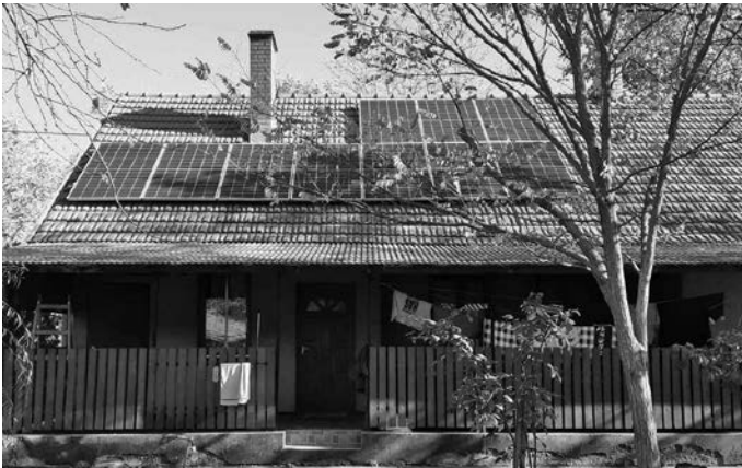
Fotón a Rostás-tanyán már üzembe helyezett napelem

A kivitelezés 2022. decemberében megkezdődött, 2023. őszén az MVM részéről is megkezdődtek a napelemmel ellátott tanyaingatlanok hálózatba történő bekötése.