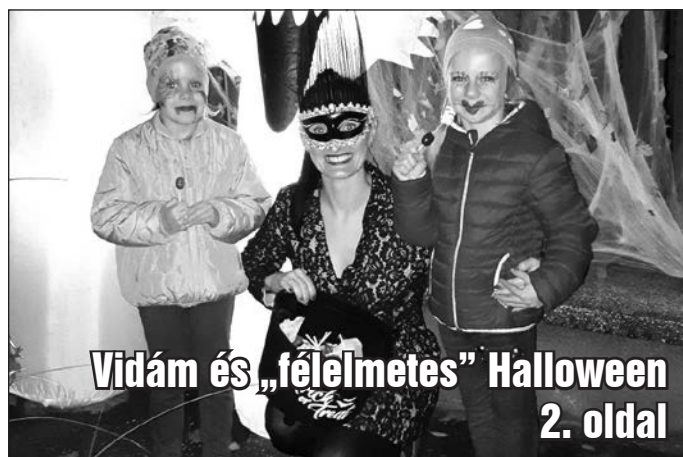
Vidám és „félelmetes” Halloween 2. oldal