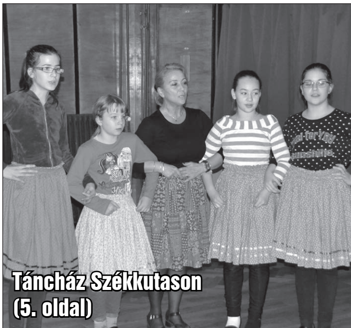
Táncház Székkutason (5. oldal)