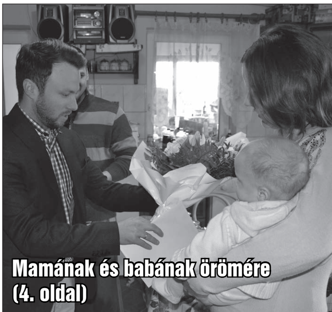
Mamának és babának örömére (4. oldal)