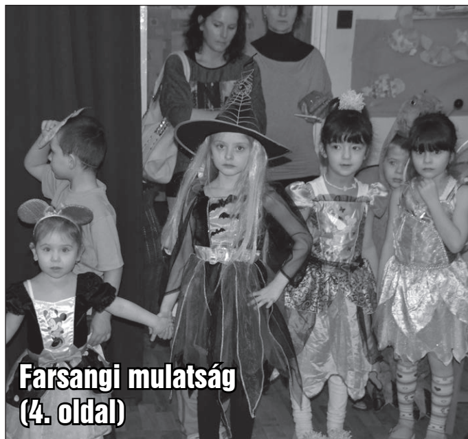
Farsangi mulatság (4. oldal)