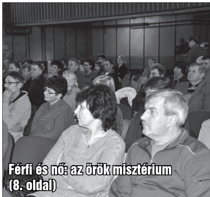
Férfi és nő: az örök misztérium (8. oldal)