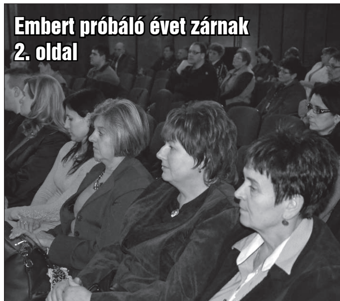
Embert próbáló évet zárnak 2. oldal