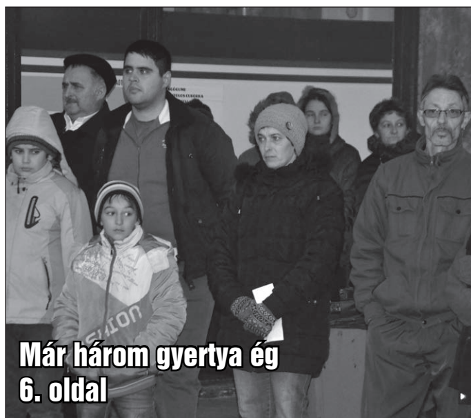
Már három gyertya ég 6. oldal