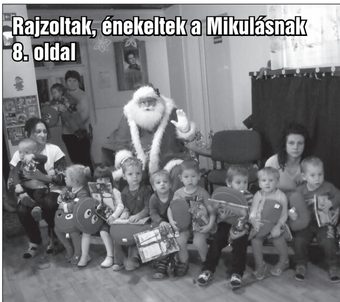
Rajzoltak, énekeltek a Mikulásnak 8. oldal

Boldog karácsonyt kíván a Kutasi Hírek szerkesztősége!