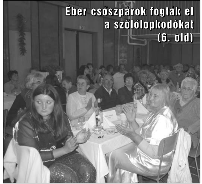
Éber csőzspárok fogták el a szőlőlopkodókat (6. old)