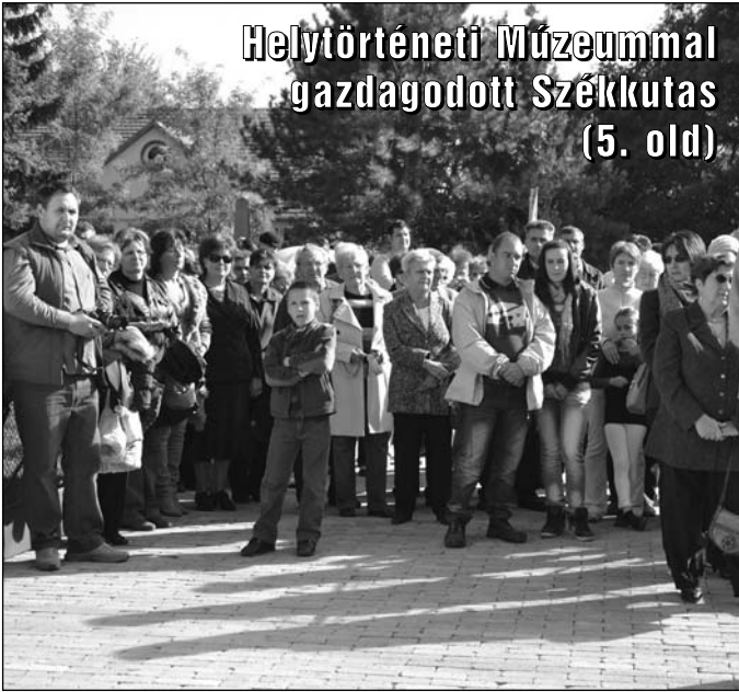
Helytörténeti Múzeummal gazdagodott Székkutas (5. old)