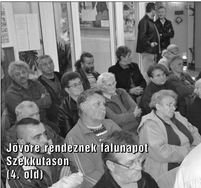
Jövőre rendeznek falunapot Székkutason (4. old)