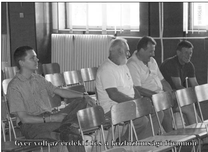
Gyér volt az érdeklődés a közbiztonsági fórumon

tosan eljárni, lakásba nem beengedni, vagy az üzlettől tartózkodni, főleg, ha az különösen nagy haszonnal kecsegtet.