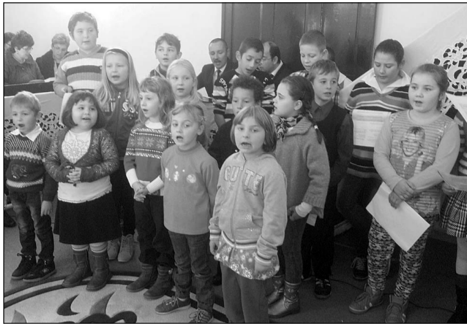
Helyi fiatalok szolgáltak a templomban ünnepi műsorral