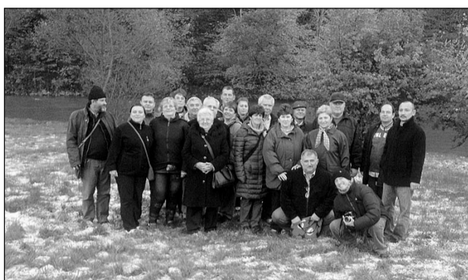
Közös fotó a székkutasiakkal a Nagymagyar barlangnál