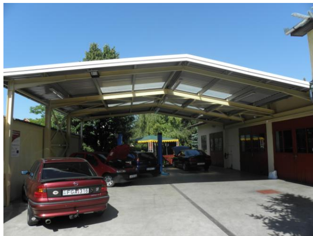
A műhely udvara a beruházást követően, korszerű tetőszerkezettel