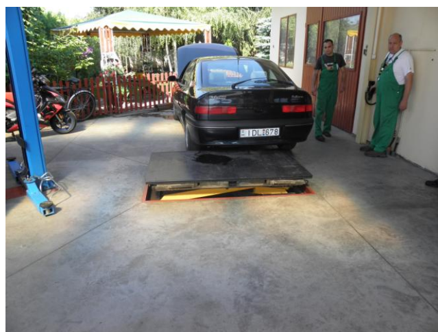
...megoldódott a levegős emelő szintbe történő süllyesztése is