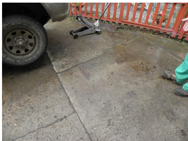
A műhely szabad ég alatt található részén...