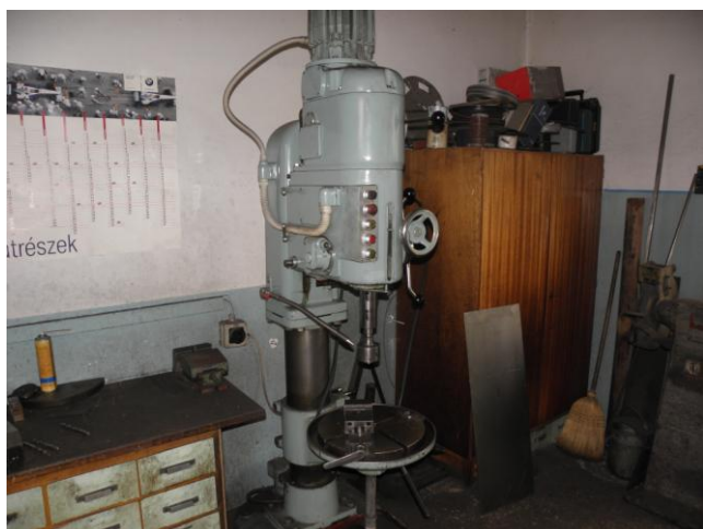
A műhely belső része a fejlesztést megelőzően