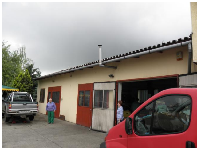
A műhely udvara a fejlesztést megelőzően

Az Új Magyarország Vidékfejlesztési Program vállalkozásfejlesztési pályázata lehetőséget biztosított arra, hogy a beruházás eredményeképpen régóta tervezett beruházások valósuljanak meg, melyek biztosíthatják a vállalkozás fejlődését. A projekt pénzügyi lezárása 2012 januárjában történt meg.