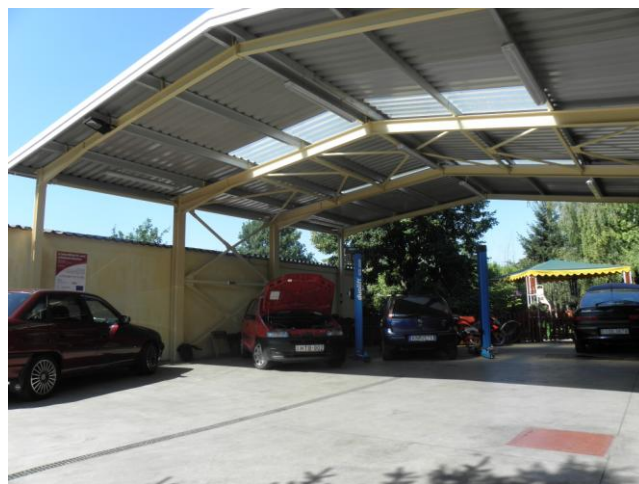
Uniós forrásból korszerű burkolat és vízelvezetés