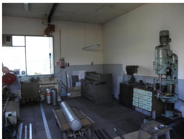
Az esztétikusabb környezet is hozzájárul a vállalkozás versenyképességének növeléséhez