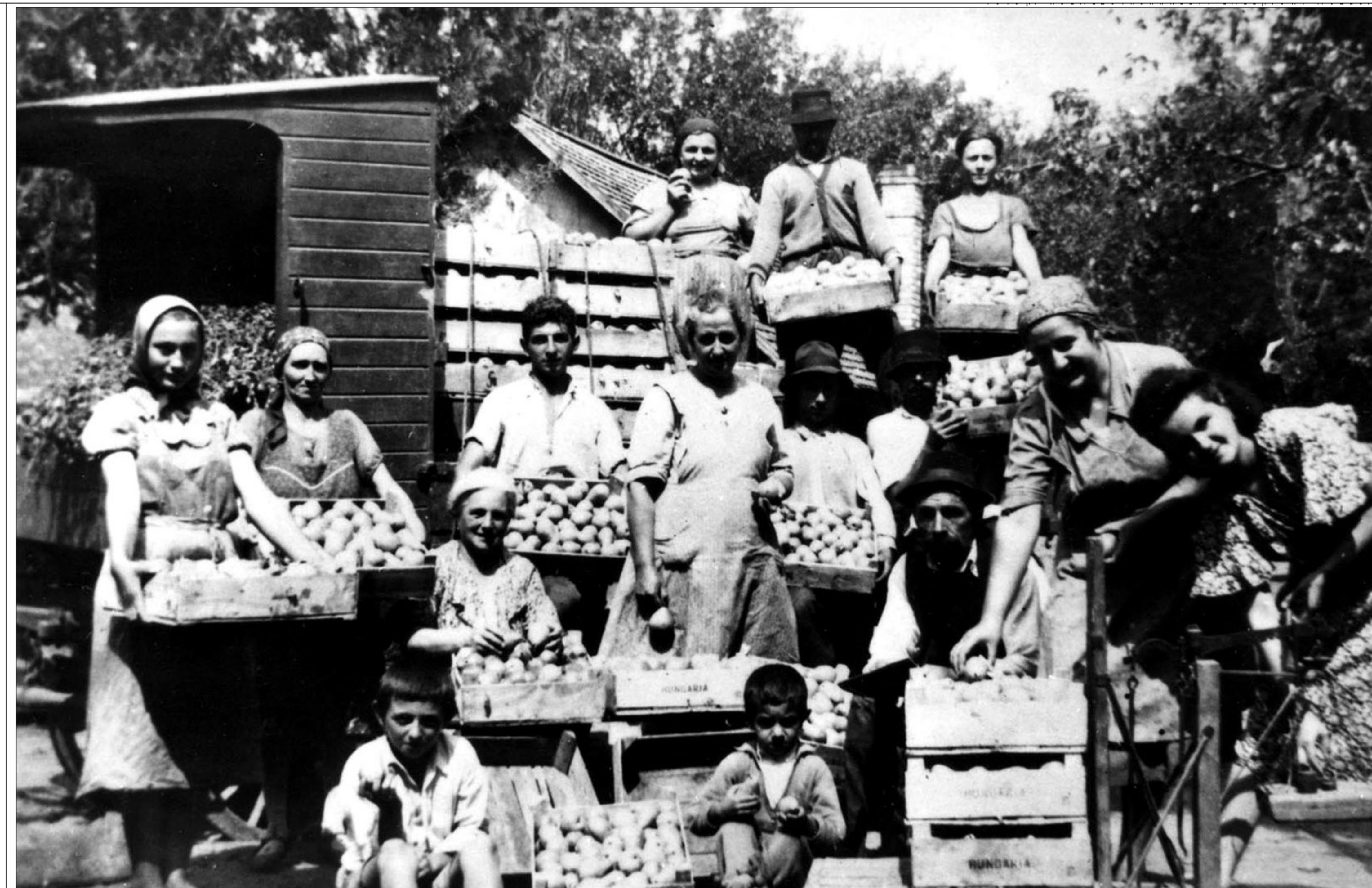
Őszibarackszüret az ezereklencszázados évek elején. Minden hozzátartozónak életkorához, adottságához igazodó feladata volt

Székkutas, a Gregus Máték és a Kun Béla utca földje